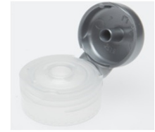
12519032 silber / silver Ø 3 mm