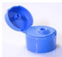
12033341 hellblau / light blue Ø 4 mm