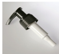
90042131 schwarz schwarz / black