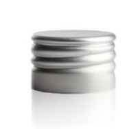
90012201 Aluminium Dreh-VS / screw on