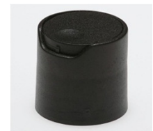
90062131 schwarz / black Ø 8 x 3 mm