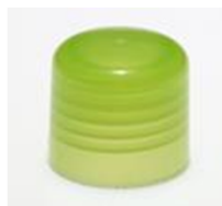
90012171 grün / green