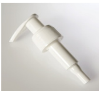
90042111 weiss / white