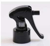
90109431 schwarz / black Mini Trigger