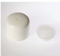
90022111 weiss / white Spritzer Ø 1,5 mm