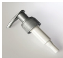
90042121 silber silber / silver