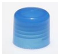
90012141 blau / blue