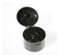
90032131 schwarz / black Ø 4 mm