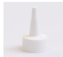
33712042 weiss / white Applikator

Einfach Flaschen kaufen! ...für Alle und Alles!