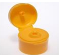
12033171 orange Ø 4 mm