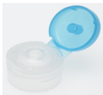
12519092 blau / blue Ø 3 mm