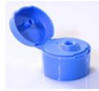
12033341 hellblau / light blue Ø 4 mm