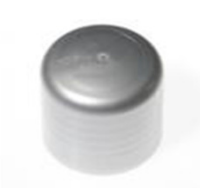
90012121 silber / silver