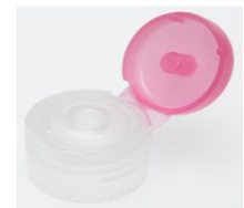
12519052 pink Ø 3 mm