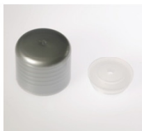
90022121 silber / silver Spritzer Ø 1,5 mm