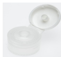
12519012 weiss / white Ø 3 mm