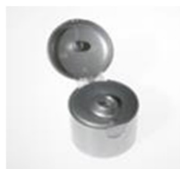
90032121 silber / silver Ø 4 mm