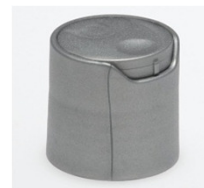
90062121 silber / silver Ø 8 x 3 mm