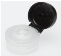
12519022 schwarz / black Ø 3 mm