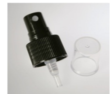
90052131 schwarz schwarz / black