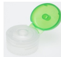
12519082 grün / green Ø 3 mm