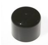
90012131 schwarz / black