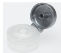
12519032 silber / silver Ø 3 mm

Einfach Flaschen kaufen! ...für Alle und Alles!