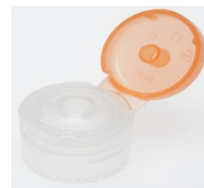
12519062 orange Ø 3 mm