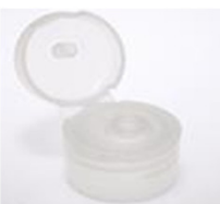
12033332 transparent Ø 4 mm