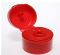
12033301 rot / red Ø 1.5 mm