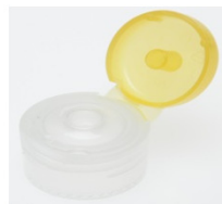
12519072 gelb / yellow Ø 3 mm