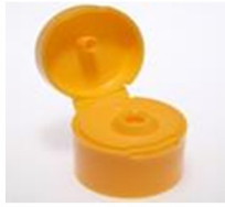
12033171 orange Ø 4 mm