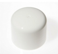
90012111 weiss / white