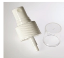
90052111 weiss weiss / white