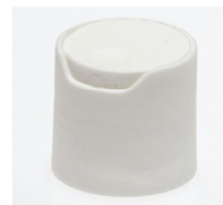
90062111 weiss / white Ø 8 x 3 mm