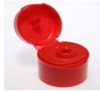
12033301 rot / red Ø 1.5 mm