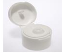
12033031 weiss / white Ø 4 mm