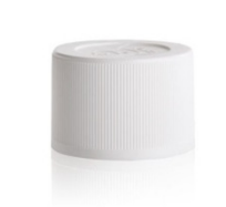
90082111 weiss / white Kindersicher / CRC