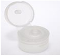
12033332 transparent Ø 4 mm