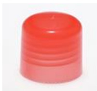
90012191 rot / red