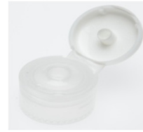
12519012 weiss / white Ø 3 mm