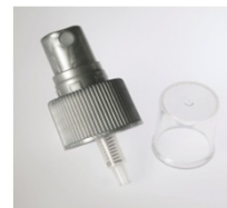
90052121 silber silber / silver