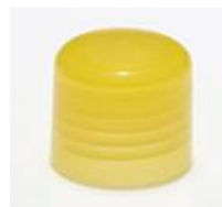
90012151 gelb / yellow