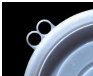
Deckel mit Griffösen