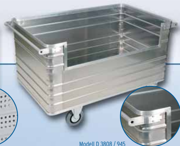
Modell D 3808 / 945

Modell: D 3008/240 mit strukturierter weitgehend kratzfester Oberfläche