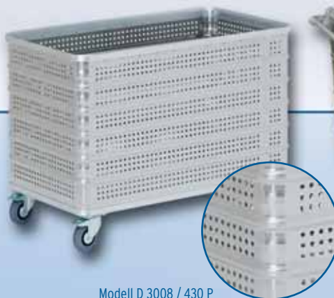
Modell D 3008 / 430 P