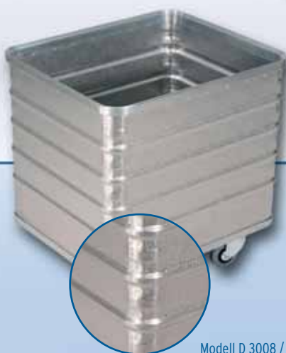
Modell D 3008 / 240