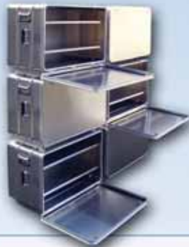
Transportkisten als Regalsystem