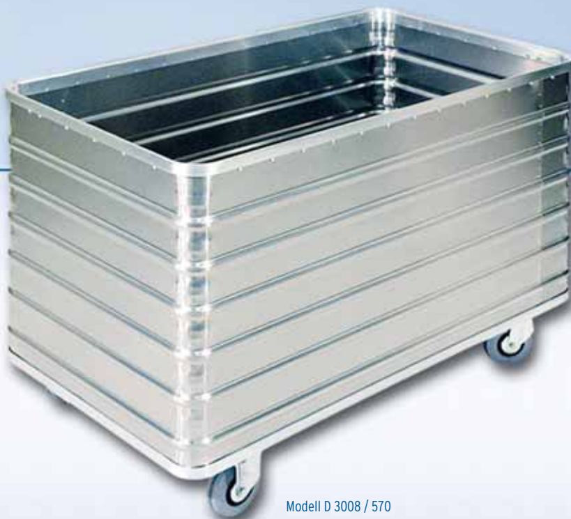
Modell D 3008 / 570