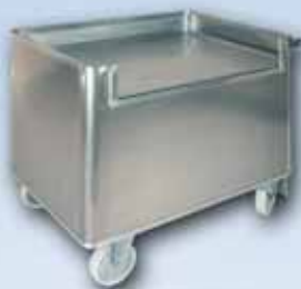
Federbodenwagen für Motorblock-Komponenten