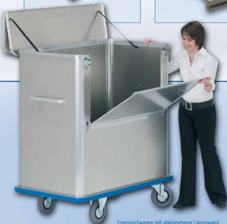
Transportwagen mit abklappbarer Längswand und geteiltem Deckel