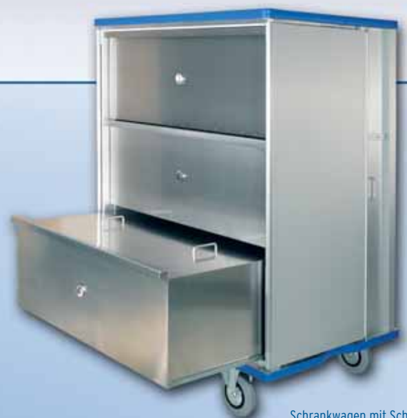
Schrankwagen mit Schubladen auf Teleskop-Auszügen