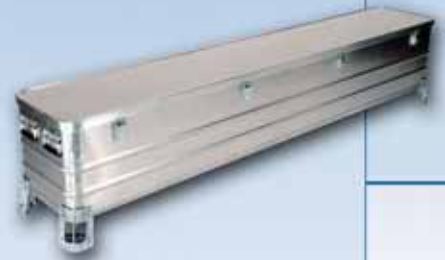
Stapelbehälter für hochwertige Langgüter