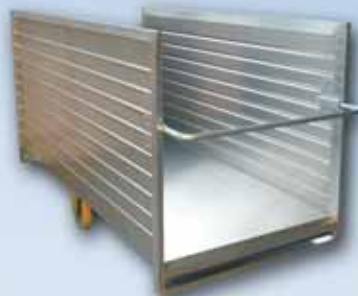
Transportwagen mit offenen Stirnwänden