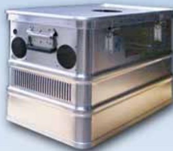
Transportkiste mit Ausstanzungen